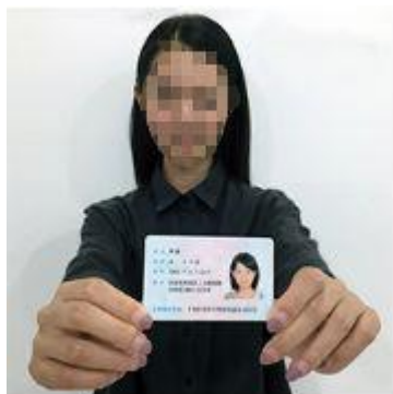
手持身份证照片示例图