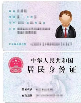
身份证照片示例图

(2) 确保身份证边框完整，头像、信息内容清晰，亮度均匀，文字正向显示，建议大小不超过 5M。